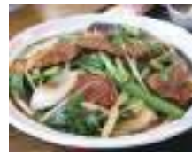
人気の二郎レバ、定食にすればボリューム満点